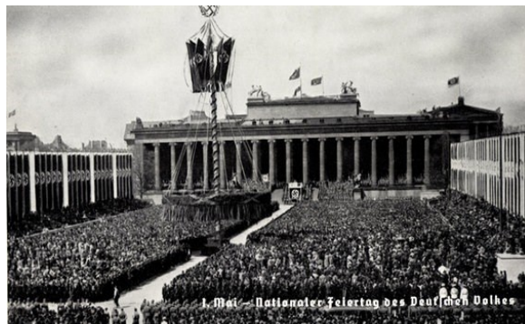
1. Mai - seit 33 arbeitsfrei!

Die NSDAP und der Führer haben jedenfalls ihrem großen Volksmandate entsprechend gehandelt. Aufgrund unbestreitbarer Erfolge sollten sich Partei, Führerkorps und Reichsführung im Laufe der Zeit nahezu die vollständige Zustimmung des Deutschen Volkes