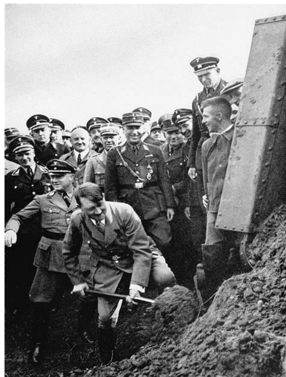
21.9.1933 - Erster Spatenstich an der Reichsautobahnbaustelle

So wurden selbst ehemalige Feinde, insbesondere aus der politischen Linken, staatlicherseits unbehelligt gelassen. Einzig Bonzen und Hetzern wurde das Handwerk gelegt. Doch auch sie sollten nicht vernichtet sondern resozialisiert werden (selbst hohe kommunistische Führer wurden später wieder aus der Schutzhaft entlassen. Selbst der Führer der KPD, Ernst Thälmann, hätte spätestens „nach dem Kriege“ gehen können. Vgl. nur Adolf Hitler - “Monologe im Führerhauptquartier“). Hören wir hierzu exemplarisch Heinrich Himmler in seiner damaligen Funktion als kommissarischer Polizeipräsident von München zur Eröffnung des ersten Konzentrationslagers (KL) in Deutschland, dem im Münchner Umlande gelegenen KL Dachau: „In einer Pressebesprechung teilte der kommissarische Polizeipräsident von München Himmler mit: „Am Mittwoch wird in der Nähe von Dachau das erste Konzentrationslager eröffnet. Es hat ein Fassungsvermögen von 5000 Menschen. Hier werden die gesamten kommunistischen und – soweit notwendig – Reichsbanner- und marxistischen Funktionäre, die die Sicherheit des Staates gefährden, zusammengezogen, da es auf die Dauer nicht möglich ist, wenn der Staatsapparat nicht so sehr belastet werden soll, die einzelnen kommunistischen Funktionäre in den Gerichtsgefängnissen zu lassen, während es andererseits auch nicht angängig ist, diese Funktionäre in die Freiheit zu lassen. Bei einzelnen Versuchen, die wir ge-